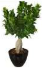
Ficus Ginseng (bonsai) v 25 l, 70

Ficus -Ginseng (bonsai) vazo 25 lartesi 70 cm.