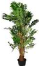
Peme artificiale, BAMBU, jeshile, 208 cm