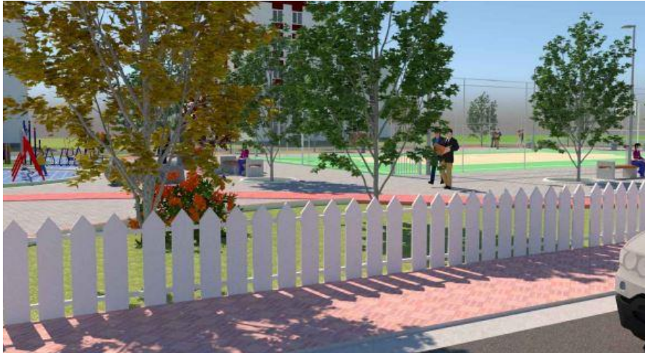
Modeli i gardhit rrethues