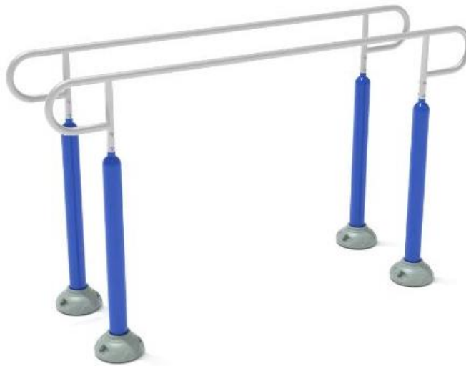
Fig.2.1 - Modeli i setit te paraleve cift