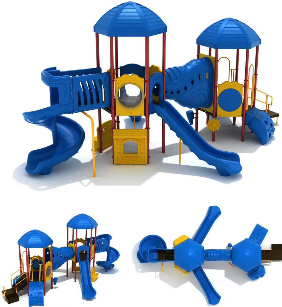
Fig.14.1 - Modeli i stacionit te lojes multifunksional per femije