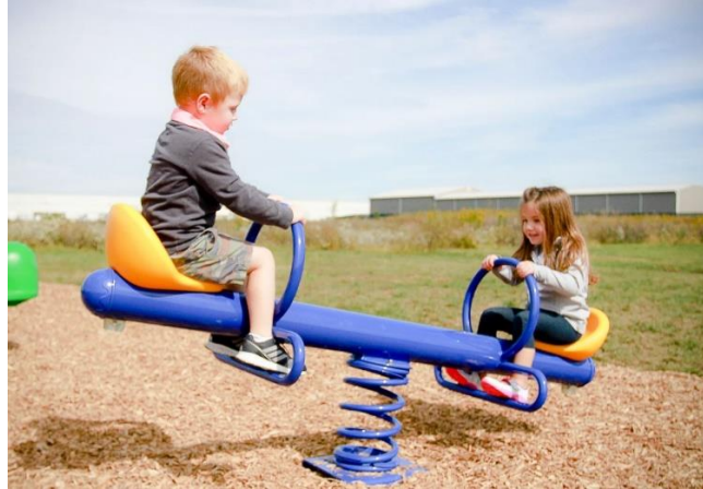
Fig.11.1 - Modeli i lekundeses dyshe per femije