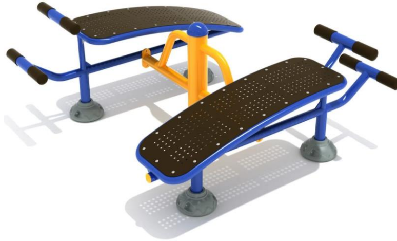
Fig.5.1 - Modeli i stolit te forces per ushtrimet e barkut