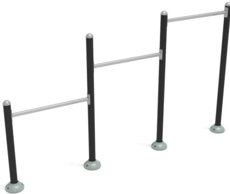
Fig.1.1 - Modeli i setit te paraleleve teke me 3 seksione

Këto shufra janë një bazë e shkëlqyer edhe për një sërë ushtrimesh të tjera, si varja, lëkundja dhe madje edhe gjimnastika bazë. Shufrat janë bërë nga copa të forta çeliku të galvanizuar, të cilat me siguri i rezistojnë ndryshkut dhe motit të keq.