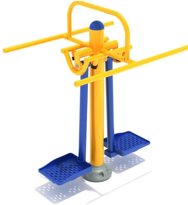
Fig.4.1 - Modeli i stacionit lavjerrës për trupin

Stacioni lavjerrës për trupin është një pajisje mjaft popullore për palestrat e jashtme që është e lehtë për të gjitha moshat e të rriturve për të vepruar. Një përdorues thjesht qëndron në bazën e lavjerrësit dhe kap dorezat e dorës. Ndërsa trupi i përdoruesit lëkundet nga njëra anë në tjetrën, ushtrohen përkulësit e kofshës midis shumë muskujve të tjerë. Dy persona mund ta përdorin pajisjen njëherësh.