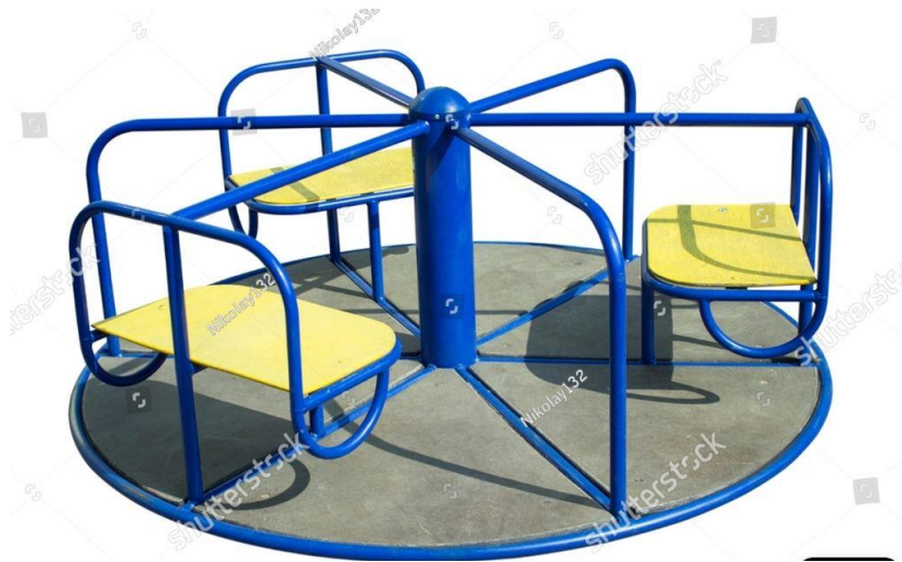
Fig.12.1 - Modeli i stacionit rrotullues për fëmijë me 3 ndenjese

Një lojë rrotulluese është një nga më të parapëlqyerat në parqet për fëmijë. Kjo pajisje ofron gezim, fëmijet do të qeshin, do të ndiejnë fluturim në barkun e tyre dhe patjetër do të argëtohen shumë. Pajisja ka një mekanizëm të poshtëm rrotullues, dhe do të ketë 3 vende me mbështetje të lehtë të pasme përmes sediljes së derdhur që është një vlerë e shtuar sigurie.