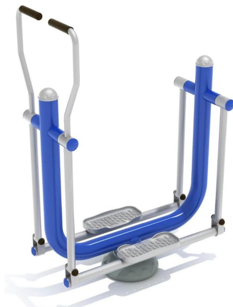
Fig.7.1 - Modeli stacionit te ushtrimit per humbjen e peshes

Vërtet, është një mënyrë fantastike dhe argëtuese për të humbur peshë, dhe kjo është pajisja e përsosur për ata që duan përfitimet e aktivitetit të lartë pa rreziqe sigurie. Pajisja rrjedh me trupin tuaj për të përsëritur ndjesinë e skijimit, duke synuar grupet e muskujve të mëdhenj dhe të vegjël për një stërvitje të plotë të trupit. Ju do të tonifikoni muskujt e shpatullave dhe këmbëve ndërsa rrisni aftësinë për qëndrim dhe ekuilibër më të mirë. Ky është mjeti i përsosur për palestra në natyrë.