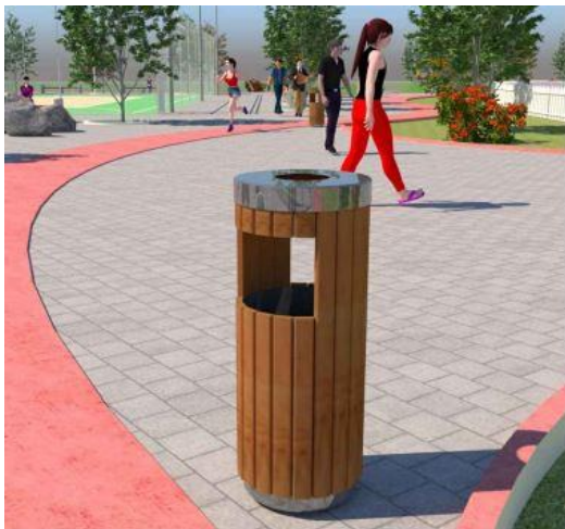
Modeli i koshave te mbetjeve

Do të realizohet sistemi i kanalizimit të ujrave sipërfaqësore të reshjeve duke përdorur tuba drenazhi fi 150, të cilat shkarkojnë në shimbledhësat e pozicionuar në krah të trotuarit ekzistues të rruges, ku këto të fundit shkarkojnë nëpërmjet tubave të brinjëzuar fi200 mm në shimbledhësat ekzistues të rrugës.