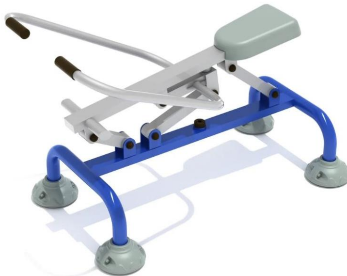
Fig.6.1 - Modeli i stacionit për ushtrime të shpinës dhe kraheve (1 cope)

Përdoruesi thjesht duhet të ulet mbi të me një shpinë të drejtë dhe të tërheqë dorezat drejt vetes. Ndërsa tërhiqen, ata ngrihen lart duke e kthyer trupin e tyre në rezistencën e nevojshme për ndërtimin e muskujve. I vendosur në katër këmbë të forta, "Single Station Roëer" qëndron mirë në vend ndërsa pesha juaj ngrihet dhe ulet përsëri. E bërë nga një kombinim i plastikës dhe metaleve me cilësi të lartë, do të jetë në gjendje të përballojë kërkesat e përdorimit të rëndë në zonat publike.