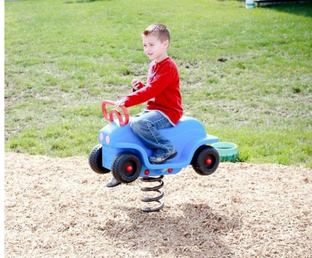
Fig.12.1 - Modeli i lodres lekundese ne forme makine