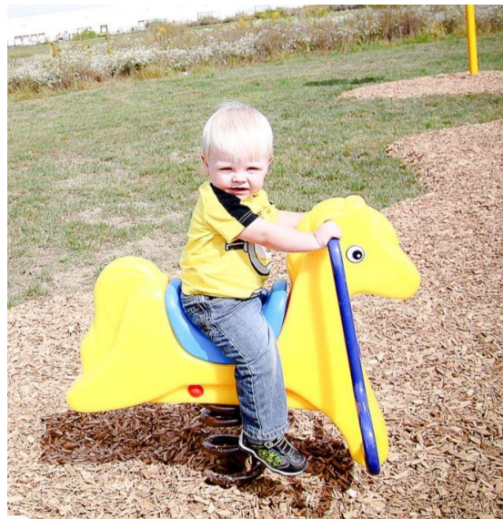
Fig.13.1 - Modeli i lodres lekundese ne forme kali