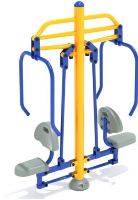
Fig.8.1 - Modeli i stacionit per ushtrimin e muskujve te kraharorit