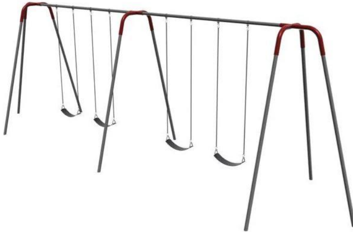
Fig.10.1 - Modeli i lisharesve per femije me 4 ndenjese (1 cope)

Këto lisharëse të thjeshta dhe të forta kanë 2 ndenjëse për seksion , zinxhir çeliku të salduar me galvanizim të nxehtë 4/0, sedilje rripash rezistente ndaj prerjes, varëse me kushineta prej bronzi vetëlubrifikuese, shina të sipërme të galvanizuar dhe këmbë të zinkuar.